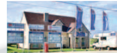
Diestsesteenweg 3 - 3390 Tielt-Winge (hoek Diestsesteenweg en Blerebergstraat)

tel 016 64 03 21 fax 016 63 15 15 e-mail janssens.janssens@era.be website www.era.be/janssens